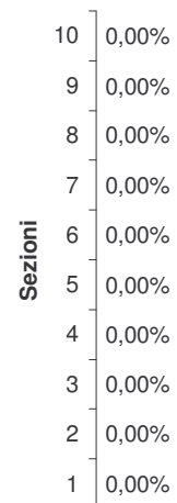
Percentuale affluenza ore 15