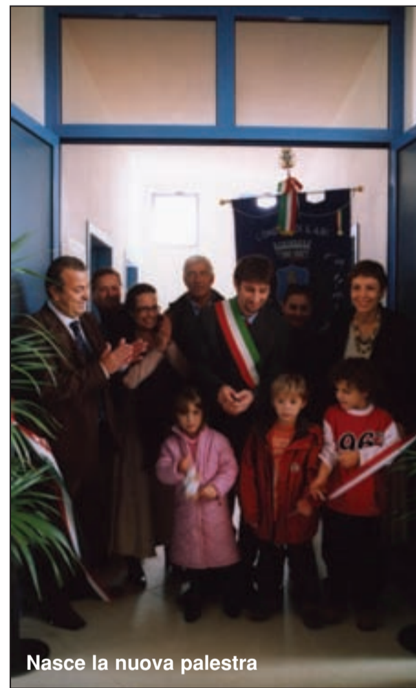
Nasce la nuova palestra

Come Amministrazione che ha portato a termine la realizzazione di questa opera non possiamo che essere particolarmente soddisfatti, ma è una soddisfazione che vogliamo e dobbiamo condividere con tutti, con le Amministrazioni delle precedenti legislature che hanno iniziato il percorso, con il Consorzio Sviluppo Valdera che ha seguito la progettazione e la realizzazione dell'opera, con tutti i dipendenti comunali, in particolare il servizio tecnico e il servizio amministrativo che con dedizione e spesso al di fuori dell'orario di lavoro hanno seguito i lavori ed organizzato le attività svolte all'interno della struttura. Condividiamo questo traguardo con tutti i cittadini - alunni e adulti - poiché questa è un'opera che ognuno deve sentire propria, perché frutto dei sacrifici di tutti.