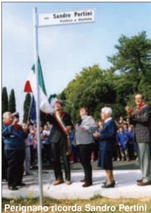
Perignano ricorda Sandro Pertini

Nonostante il passare degli anni il Presidente Sandro Pertini resta un figura moderna e illuminante per la Nazione ed è perché come lui questa Amministrazione ha fiducia nei giovani che abbiamo voluto che la via davanti alle Scuole si intitolasse proprio a lui, affinché i ragazzi, di oggi e di domani, si chiedano e sappiano chi è stato il Presidente Sandro Pertini.