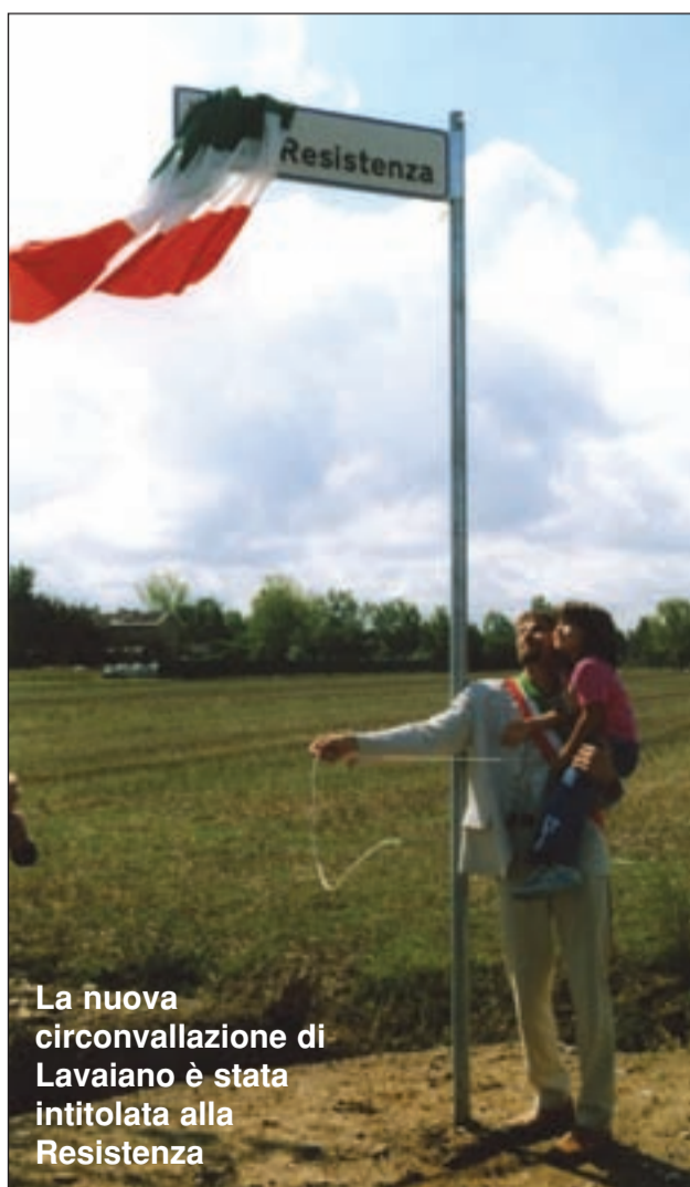
La nuova circonvallazione di Lavaiano è stata intitolata alla Resistenza

Un Viale che "abbraccia" e "protegge" il paese, la strada della Resistenza.