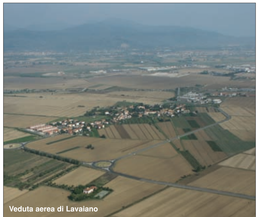
Veduta aerea di Lavaiano

Se la strada di collegamento fra le due zone industriali è stata denominata "Via dell'Arginello", nome noto ai contadini del luogo e preso in prestito dal fosso che attraversa la zona, la nuova circonvallazione è stata intitolata alla Resistenza. Sì, alla Resistenza, a quel movimento di cittadini liberi che scelsero di ribellarsi al regime nazi - fascista e che lottarono e sacrificarono la loro vita, per recuperare per sé e per noi la libertà.